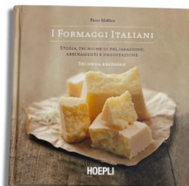
Libro di testo