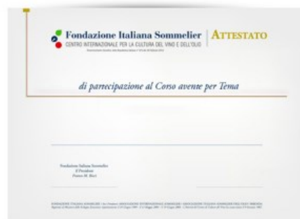
Attestato di partecipazione di Fondazione Italiana Sommelier